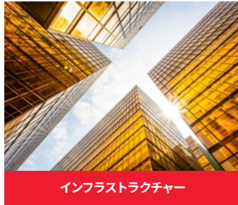
インフラストラクチャー